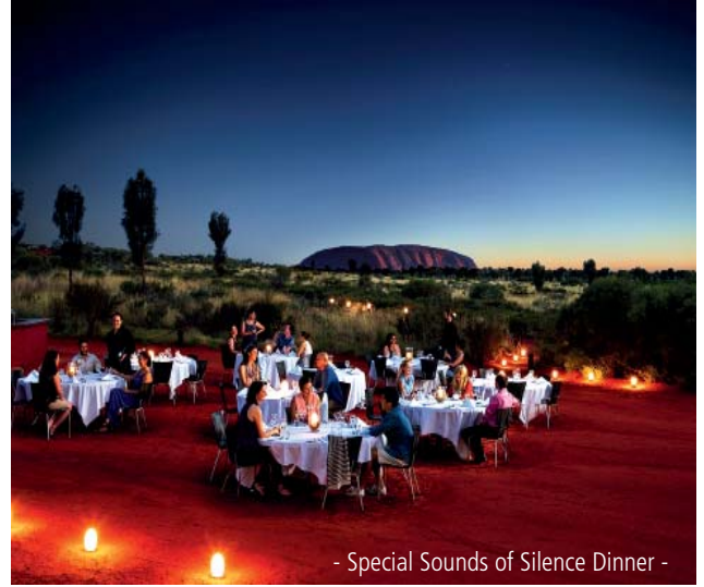
- Special Sounds of Silence Dinner -